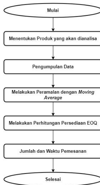
Gambar 1 Rancangan Analisis