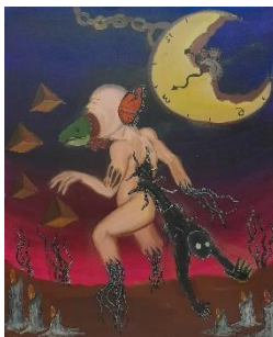
Gambar 10. Sepotong Salmon dan Sukma Nan Meronta

Ukuran 120x100cm. Media Acrylic on Canvas