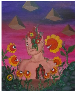
Gambar 6. Ladang Hiruk Hipuk #1

Ukuran 120x100 cm. Media Acrylic on Canvas