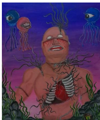
Gambar 4. Merobek Rongga Dada

Ukuran 120x100 cm, Media Acrylic on canvas