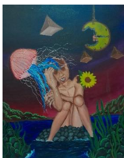
Gambar 9. Ya, Tidak Apa-apa

Ukuran 120x100 cm. Media Acrylic on Canvas