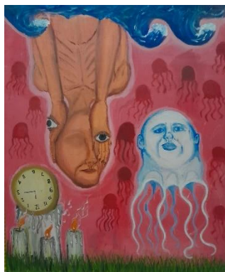
Gambar 2. Kesalahan Ada Pada Mata Anda

Ukuran 120x100 cm. Media Acrylic on canvas