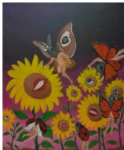
Gambar 7. Ladang Hiruk Pikuk #2

Ukuran 120x100 cm. Media Acrylic on Canvas Tahun 2023