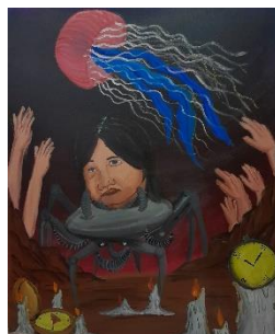
Gambar 8. Sandyakala Pada Kurusetra

Ukuran 120x100 cm. Media Acrylic on Canvas