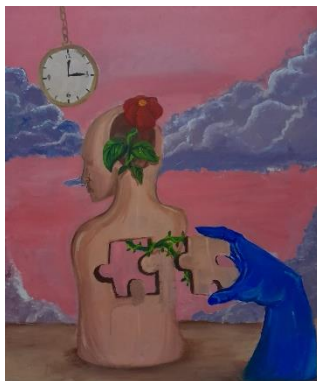
Gambar 1. "Sekeping Renjana"

Ukuran 120x100 cm. Media Acrylic on Canvas