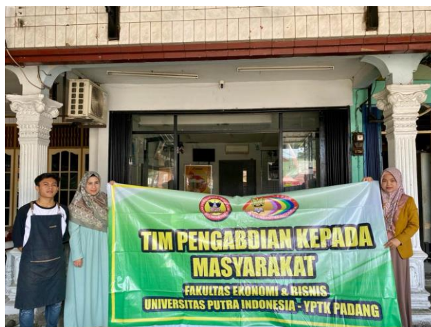
Gambar 2. Tim PKM UPI-YPTK bersama owner D'Sruput

Pada Gambar 2 terlihat tim PKM UPI-YPTK bersama owner D'Sruput. Dokumentasi ini diambil setelah pelatihan dilakukan. Hasil kegiatan selama lebih kurang satu bulan ini, sejalan dengan target dan luaran yang diinginkan. Perubahan tersebut terjadi secara bertahap, dimulai dari pemahaman Just In Time (JIT) sampai dengan pemahaman produktivitas dan efisiensi biaya produksi. Selain itu, untuk hasil kegiatan ini berhasil dengan