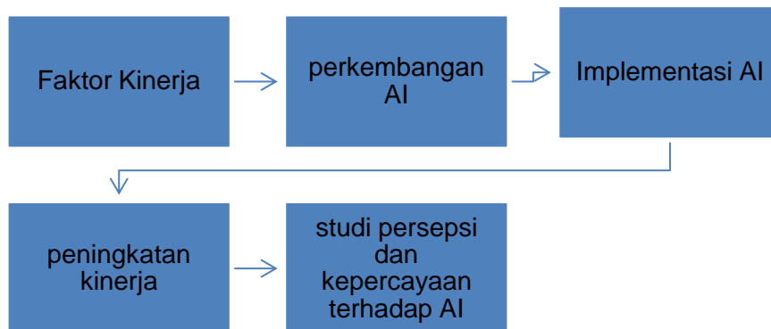
Gambar 1. Kerangka Konsep Penelitian

Berikut daftar pertanyaan yang diberikan pada saat melakukan wawancara dengan informan penelitian: