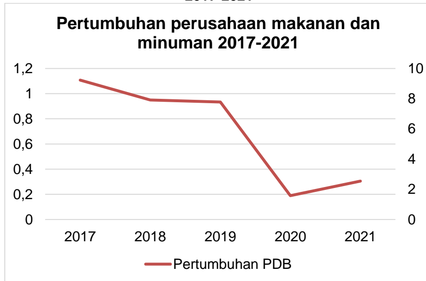
Gambar 1.1 Data pertumbuhan

Terlihat pada gambar 1.1 perusahaan sektor makanan dan minuman mengalami kenaikan dan penurunan dari tahun 2017-2021. Pada grafik tersebut terlihat bahwa tahun 2017 perkembangan awal grafik berada pada prosentase 9,23% dengan total PDB 834.425,1 triliun, di tahun 2018-2019 terjadi sedikit penurunan dengan selisih prosentase 0,13 %. Di tahun 2020 terjadi penurunan secara drastis diakibatkan pandemi covid-19. Prosentase menunjukkan 1,58% dengan total PDB 1.057.000 triliun. Terdapat selisih 6,2% jika dibandingkan dengan tahun 2019. Akan tetapi pada tahun 2021 terjadi kenaikan dan perkembangan dari sektor makanan dan minuman ini menjadi 2.54% dengan total PDB 1.121.360.2 triliun.