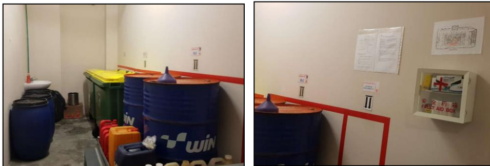
Gambar Foto Tempat Penyimpanan Sementara (TPS) Limbah B3