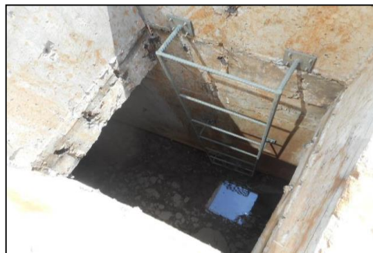
Gambar Foto Lokasi Pembangunan Resapan Air ( Long Soak Pond )