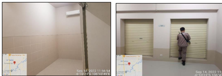
Gambar Foto Tempat Sampah dan Tempat Penampungan Sementara (TPS) Sampah Tower 2

Pengelolaan sampah makanan dan minuman dari perkantoran serta hunian atau tempat tinggal dikumpulkan dan difermentasi sehingga menjadi cairan yang bermanfaat untuk dijadikan sebagai pupuk. Cairan tersebut, digunakan sebagai pupuk untuk pertamanan.