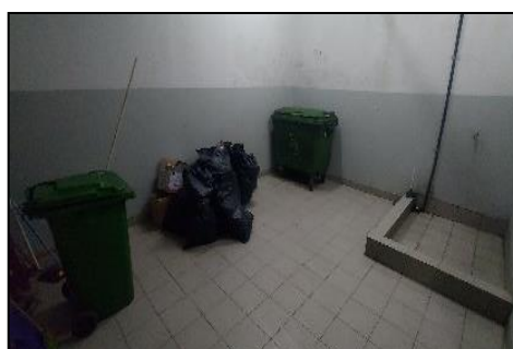
Gambar Foto Tempat Sampah dan Tempat Penampungan Sementara (TPS) Sampah Kegiatan Hunian/ Apartemen

Pengoperasian Perkantoran, hunian/tempat tinggal dan berbagai fasilitasnya “Ciputra International” juga menghasilkan limbah B3 (Bahan Berbahaya Beracun) berupa oli bekas, Lampu TL dan sisa cartridge, bekas kemasan cat, tonner, dan lainnya ditampung pada TPS Limbah B3. Pengelolaan limbah B3, pihak pengelola gedung telah menyediakan Tempat Penyimpanan Sementara (TPS) Limbah B3 di Lantai Basemen 1 dimensi dimensi 3 m x 1,5 m x 2,5 m. Izin TPS Limbah B3 Terlampir.