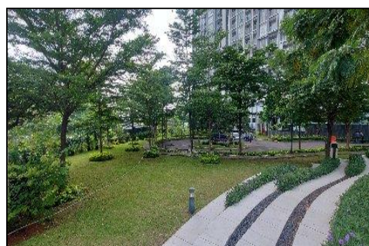
Gambar Foto Ruang Terbuka Hijau (RTH) di lokasi Kegiatan Perkantoran