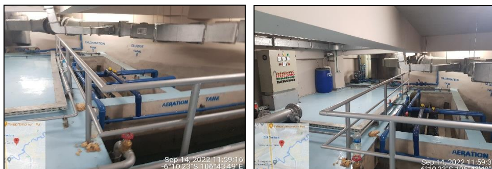
Gambar Foto IPAL (Instalasi Pengolahan Air Limbah) dengan Sistem Extended Aeration pada kegiatan Perkantoran dan Hunian