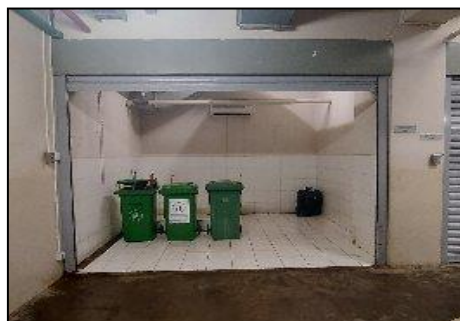
Gambar Foto Tempat Sampah dan Tempat Penampungan Sementara (TPS) Sampah Tower 3