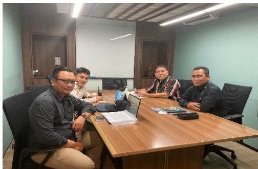
Gambar Foto Pertemuan Tim Peneliti dan Staf Ciputra Internasional