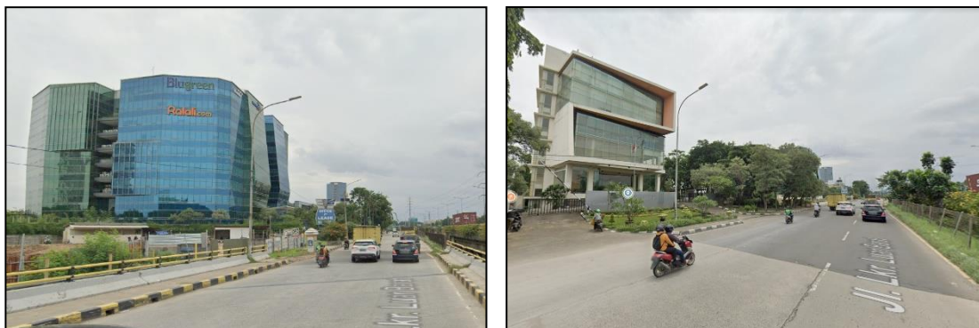
Gambar Foto Kegiatan Lingkungan Sekitar dan Jl. Lingkar Luar Barat

Lingkungan kegiatan pada garis sepadan Jl. Lingkar Luar Barat padat pada jam-jam sibuk pagi dan sore hari. Kegiatan Perkantoran, Hunian dan Fasilitasnya “Ciputra International” adalah untuk memberikan pelayanan terhadap penyediaan perkantoran dan hunian/apartemen juga diikuti dengan pembangunan-pembangunan di sekitar kegiatan.