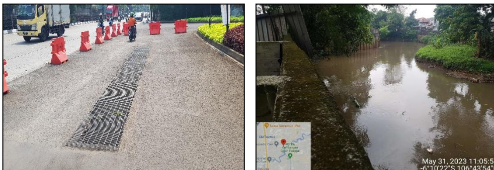
Foto Drainase Makro (Sisi Badan Jl. Lingkar Luar Barat) pada bangunan dan pembuangan pada sungai angke

Seluruh air larian yang berasal dari catchment area Perkantoran, Hunian dan Fasilitasnya “Ciputra International” dan lingkungan sekitarnya sebagian besar mengalir ke saluran drainase kota yang berada di sisi badan Jl. Lingkar Luar Barat selanjutnya secara gravitasi bermuara ke Kali Angke yang berada di sebelah Selatan dan sebelah Timur lokasi kegiatan.