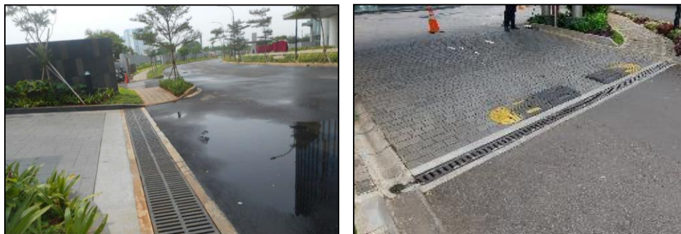
Gambar Foto Sistem Drainase Mikro Hunian/Apartemen