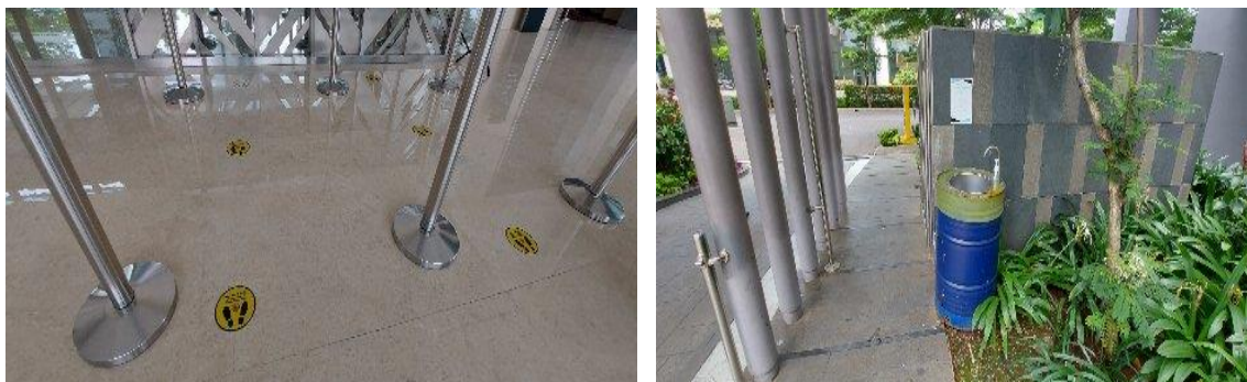
Gambar Foto Pelaksanaan Protokol Pencegahan dan Pengendalian Covid-19