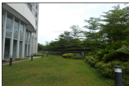
Gambar Foto Ruang Terbuka Hijau (RTH) dilokasi Kegiatan Hunian/Apartemen