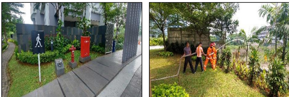
Gambar Foto Hydrant dan APAR dan Simulasi Pemadam Kebakaran

Pos keamanan juga telah dilengkapi dengan fasilitas komunikasi untuk mempermudah hubungan ke nomor-nomor penting seperti pos pemadam kebakaran terdekat, ambulance dan rumah sakit terdekat. Pencegahan bahaya kebakaran di dalam dan di luar bangunan mengacu kepada Rekomendasi/ Sertifikat Keselamatan Kebakaran NOMOR 286/E.1/31.73.01.1003. 05.001.K.1.b/1/-1.784.1/e/2022, tanggal 20 Oktober 2022 dari Dinas Penanaman Modal dan Pelayanan Terpadu Satu Pintu Prov. DKI Jakarta