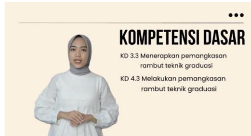
Gambar 5. Tampilan Kompetensi Dasar