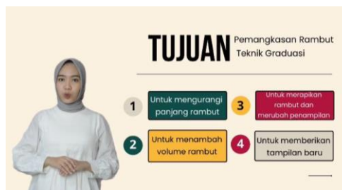
Gambar 6 . Tampilan Tujuan Pembelajaran