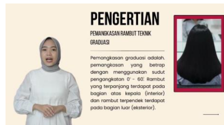
Gambar 7. Tampilan Materi Pemangkasan Rambut Teknik Graduasi