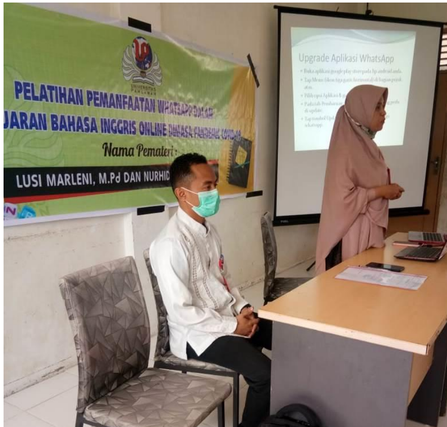
Gambar 3. Foto saat pelatihan berlangsung.