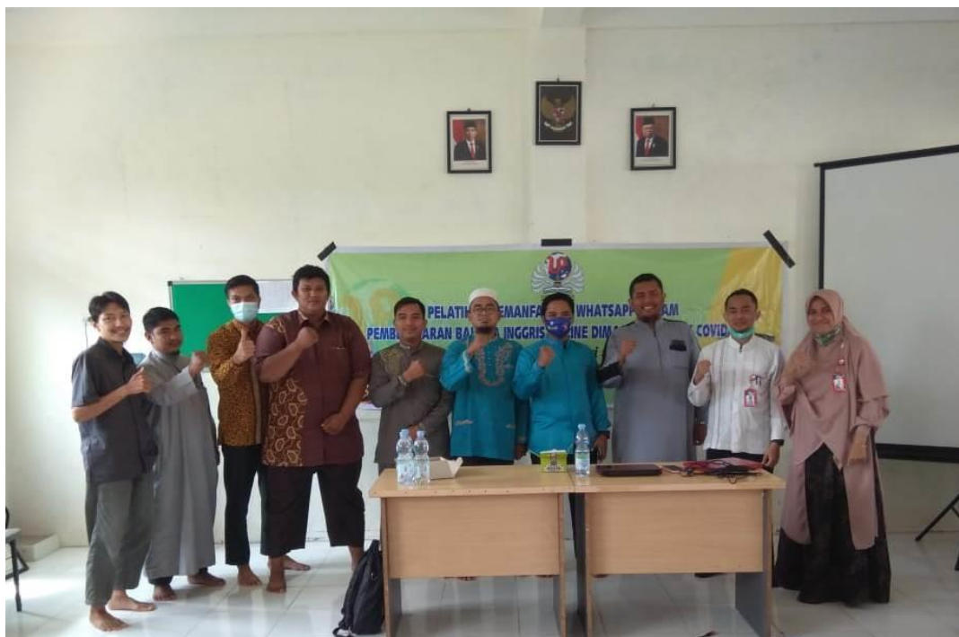
Gambar 4. Foto bersama dengan guru-guru peserta pelatihan Classroom