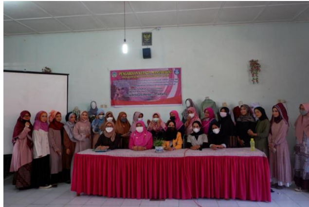
Gambar 4. Hasil Praktek Rias Wajah Pengantin