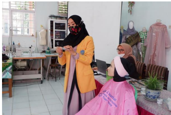
Gambar 1. Demo Rias Pengantin Muslim

Berikut ini gambar-gambar kegiatan pengabdian masyarakat di Madrasah Aliyah (MA) Plus Keterampilan Se Sumatera Barat: