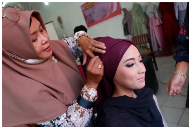
Gambar 3. Praktek Rias Wajah Pengantin