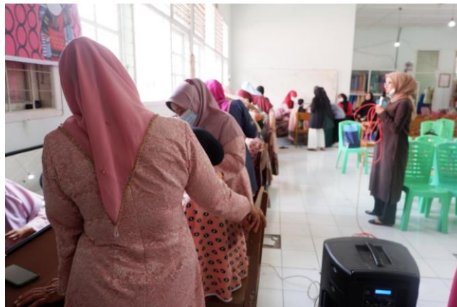
Gambar 2. Praktek Rias Pengantin Muslim