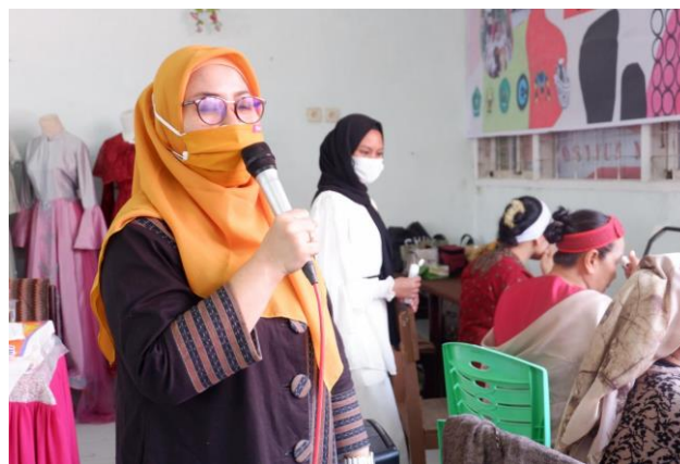
Gambar 5. Perawatan Kulit Wajah