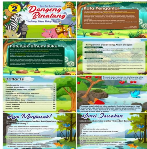
Gambar 1.2 Kerangka Buku Bergambar