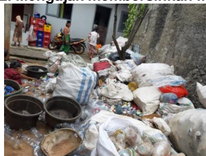
Gambar 3. Lingkungan tempat masyarakat