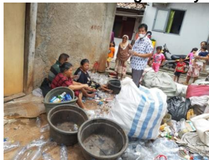
Gambar 2. Mengajak membersihkan lingkungan