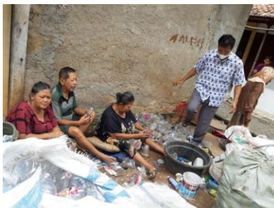
Gambar 4. penyuluhan

Penyuluhan dilakukan pada hari Minggu, 15-16 Desember 2021 pada pukul 10.00 WIB. Proses penyuluhan dilakukan dengan mendatangi setiap pemulung di titik kerjanya masing-masing. Semua peserta pengabdian sangat antusias mendengarkan pemaparan materi yang dibacakan. Dan masyarakat juga di ajak untuk gotongroyong dalam memberishkan lingkungan terutama lingkungan yang beserakan dengan hasil pencarian limbah plastik sebagai hasil mata pencarian. Tim pelaksana dan mahasiswa melakukan sosialisasi dan pembagian paket makanan sehat. Sistem penyuluhan dilakukan dengan sistem diskusi dan bincang-bincang. Hal ini ditujukan untuk mengefektifkan proses sosialisasi. Proses penyuluhan tidak bisa dilakukan dengan mengumpulkan para pemulung karena mereka sedang beraktivitas mengumpulkan sampah yang akan dijual kembali. Sehingga tim pelaksana mendatangi pemulung satu persatu. Di TPA terdapat 10 orang pemulung yang sedang bekerja