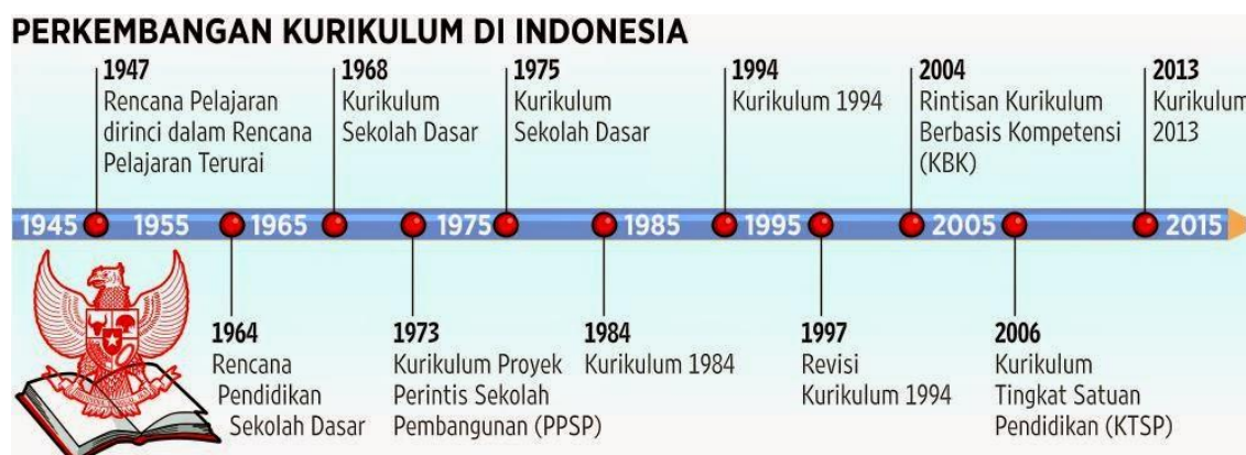
Gambar 1. Perkembangan Kurikulum di Indonesia

Dalam sejarah pendidikan modern di Indonesia, kurikulum telah mengalami banyak perubahan (penyempurnaan) sejak era kemerdekaan, paling sedikit 11 kali selama ini, 8 kali sebelum era otonomi daerah dan 3 kali setelah era otonomi daerah. Kurikulum 1947, Kurikulum 1964, Kurikulum 1968, Kurikulum 1973 (Program Perintis Pengembangan Sekolah), Kurikulum 1975, Kurikulum 1984, Kurikulum 1994, Kurikulum Kejuruan 1999 (Kurikulum Intensif 1994), Kurikulum 2004 (Kurikulum Berbasis Kompetensi, Kurikulum 2006 (Kurikulum Tingkat Satuan Pendidikan), Kurikulum 2013 (kurikulum yang menekankan pada pengembangan pengetahuan, keterampilan dan sikap secara holistik berbasis kompetensi). (Faedoni. 2019).