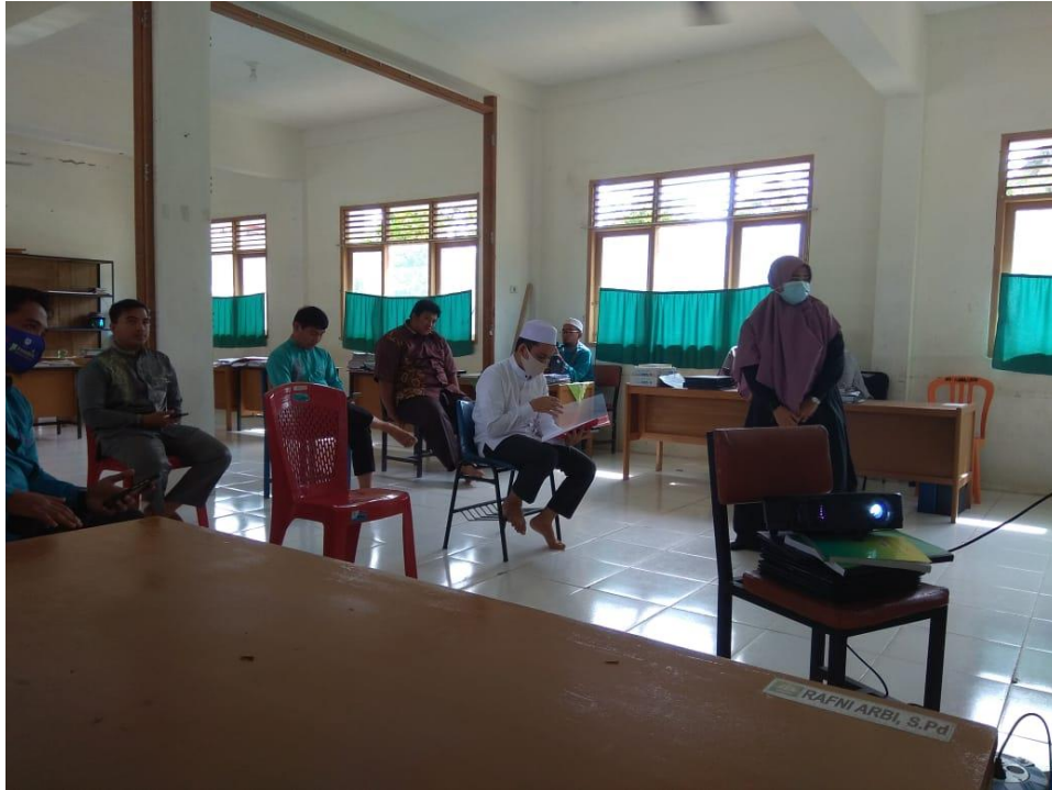
Gambar 1. Suasana upgrade Aplikasi WhatsApp

Berdasarkan hasil observasi dan evaluasi pelaksanaan upgrade dan integrasi aplikasi WhatsApp, tim dapat menyimpulkan bahwa masih banyak guru di MTs AL-Hutsaimin masih belum mengupgrade aplikasi WhatsApp di smartphone masing-masing. Dari 26 orang guru, hanya 10 guru yang telah mengaupgrade aplikasi WhatsApp.