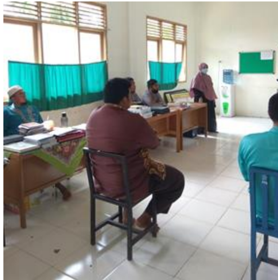
Gambar 2. Suasana pelatihan pemanfaatan WhatsApp dalam pembelajaran

Dalam memanfaatkan WhatsApp sebagai media pembelajaran guru mesti terbiasa dalam menggunakan menu yang ada pada WhatsApp yang dipaparkan sebagai berikut: