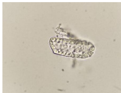
Gambar 2. Telur Ascaris lumbricoides Unfertilized Egg