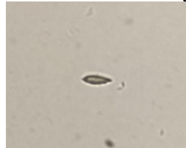
Gambar 4. Telur Trichuris trichiura

Untuk melihat hubungan antara variabel independen ( personal hygiene , penggunaan alat pelindung diri dan masa kerja) dengan variabel dependen (kejadian cacing) dilakukan analisis bivariat. Uji statistik yang digunakan adalah Chi-Square dan diambil keputusan: apabila P value \alpha (0,05) maka H_0 ditolak, berarti tidak ada hubungan yang bermakna ( significance ).