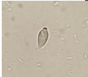
Gambar 3. Telur Trichuris trichiura