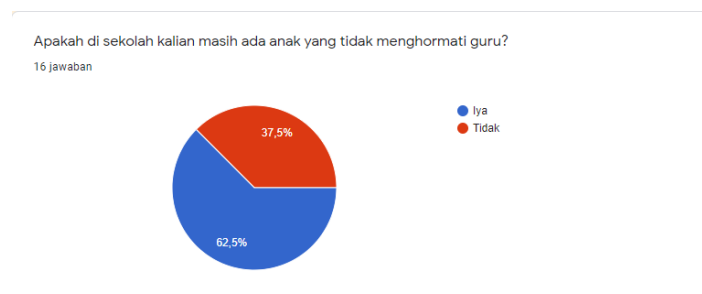
Gambar 2. Anak yang tidak menghormati guru

Bahkan secara mengejutkan, lebih dari 50% pelajar mengaku bahwa di sekolahnya masih ada beberapa anak yang tidak menghormati gurunya. Harusnya dengan adanya berbagai kemajuan yang ada di Indonesia ini kan membuat cara berpikir, karakter, dan moral para pelajar jauh lebih baik, bukan justru kebalikannya. Bahkan hampir 50% dari mereka mengaku bahwa di sekolahnya masih ada kasus bullying yang terjadi antara satu dan lainnya.