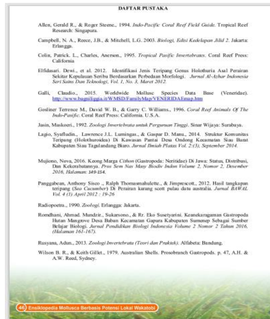
Gambar 6. Daftar Isi

Bagian belakang ensiklopedia terdiri atas daftar pustaka. Daftar pustaka merupakan daftar referensi yang merupakan rujukan untuk identifikasi Mollusca dan Echinodermata serta bahan materi yang dimuat dalam ensiklopedia. Terdapat 14 sumber refereni yang masing-masing terdiri 6 buku 6 jurnal internasional maupun nasional.