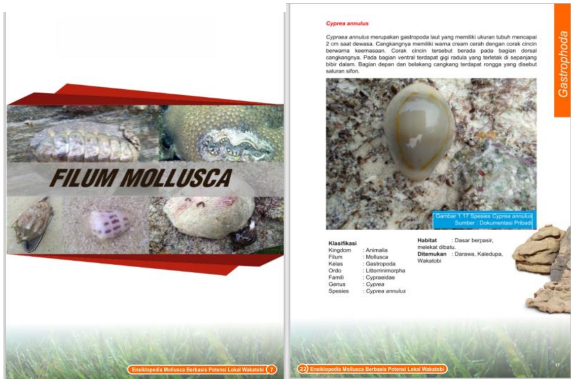
Gambar 4. Halaman Isi

Halaman Isi dapat dilihat pada Gambar 4.