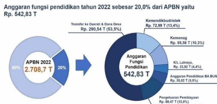
Gambar 1. Rincian Anggaran yang dikeluarkan oleh Pemerintah

Selain itu kegiatan ini juga merupakan salah satu bentuk peningkatan SDM. Dimana hal ini diharapkan dapat mengisi kekurangan pada saat pembelajaran online yang telah diterapkan selama masa pandemik. Selanjutnya Langkah nyata yang dilakukan pemerintah adalah memberikan perhatian khusus serta peningkatan anggaran dana (khususnya dalam rangka penanganan dampak pandemi Covid-19 pada sektor pendidikan). Dimana hal ini perlu dilakukan karena hampir setiap negara merasakan dampak yang sama akibat pandemik. Selain itu juga, hal ini dilakukan untuk merangsang dan meningkatkan kualitas Pendidikan. Keseriusan ini terlihat dari rincian anggaran yang dikeluarkan pemerintah seperti yang dijelaskan pada gambar 1.: