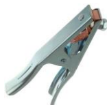
Gambar 7. Klem Las

Digunakan sebagai alat penghubung kabel massa ke logam induk, alat ini biasanya terbuat dari tembaga atau logam lain yang mempunyai sifat penghantar listrik yang baik.