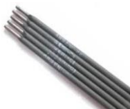
Gambar 4. Elektroda

Elektroda atau kawat las adalah suatu benda yang dipergunakan untuk melakukan pengelasan listrik yang berfungsi sebagai pembakar yang akan menimbulkan busur nyala.