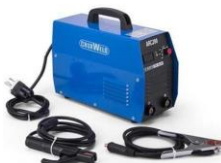
Gambar 6. Mesin Las

Mesin Las adalah mesin yang dapat menyambung besi menjadi satu rangkaian utuh sehingga dapat membentuk sebuah bentuk yang anda inginkan atau butuhkan.