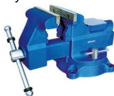
Gambar 5. Ragum

Perangkat mekanis ini digunakan untuk menahan benda kerja. Menjadi alat yang sangat penting dalam banyak pengerjaan kayu, pengerjaan logam, dan aplikasi manufaktur lainnya.