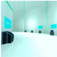
Gambar 13. Halaman Ruang Pengenalan

Menu ruang pengenalan digunakan apabila player ingin masuk dan akan menampilkan alat-alat pengelasan SMAW secara virtual dimulai dengan adanya deskripsi dan video dari alat tersebut yang telah disediakan.