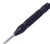
Gambar 2. Penitik

Penitik adalah suatu alat yang digunakan untuk membuat tanda berupa titik pusat atau titik-titik garis.