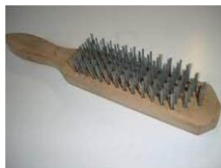
Gambar 3. Sikat Baja

Sikat baja / kawat putih merupakan perkakas yang digunakan untuk membersihkan area di sekitar meja kerja, peralatan bengkel seperti kikir dan benda las yang memiliki terak.