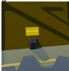
Gambar 12. Halaman Awal

Halaman awal, merupakan halaman utama dari aplikasi virtual reality materi Teknik Pengelasan SMAW. Pada halaman ini player akan dihadapkan pada empat pilihan menu yaitu info aplikasi, menu jobsheet dan materi, ruang praktik las, dan ruang pengenalan.