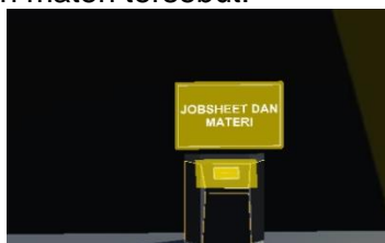
Gambar 15. Halaman Menu Jobsheet dan Materi

Halaman menu ini, player akan dihadapkan jobsheet dan materi yang telah disediakan. Jika diklik tombol masuk, maka akan langsung muncul tampilan jobsheet dan materi tersebut.