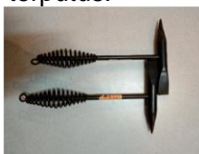
Gambar 1. Palu Terak

Palu terak atau dalam bahasa Inggris dikenal dengan Chipping Hammer digunakan untuk membersihkan terak ketika anda selesai mengelas atau saat menyambung jalur las yang terputus.